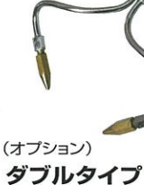
(オプション) ダブルタイプ