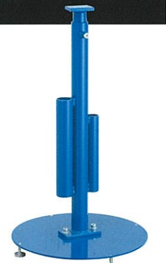
セーバースタンド SAVER STAND ◆ <N-500> <N-700> <N-1000>に 対応。作業高さが調整できます。 ◆ Correspondence to <N-500> <N-700> <N-1000>. Adjust height.