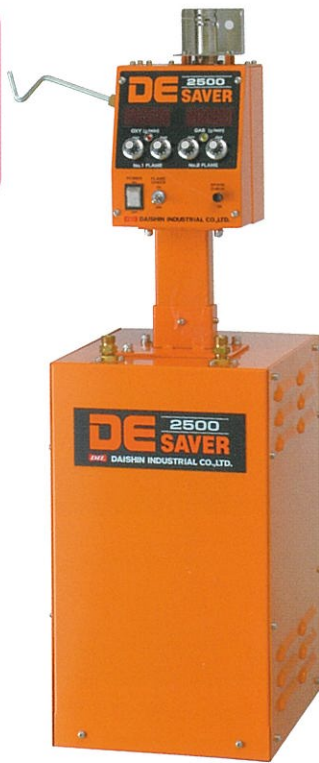
流量制御強弱切替モデル Setting Strong and Weak Flame with Flow Control DE-2500 PATENT REGISTERED