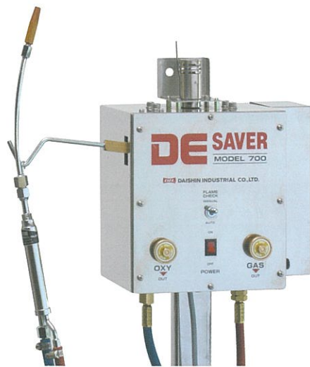
強弱2火炎切替(手動)モデル Setting Strong and Weak Flame N-700

The pilot flame for conventional Gas saver are using about 300cc of gas in 1 minute. Comparison of gas consumption per year. (Examining by our company) Mechanical gas saver JP ¥ 50,616.- DE SAVER (N-500) JP ¥ 0.-