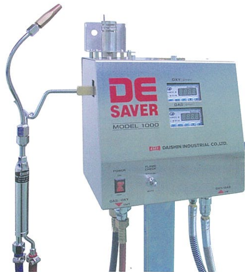
デジタル流量表示モデル Flowmeter Inseted Type N-1000

◆ DEセーバー写真のトーチは別売です。 The torch set in the picture is not included to this device